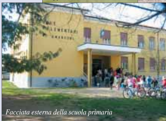
Facciata esterna della scuola primaria