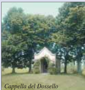
Cappella del Dossello

Anche quest'anno la finanziaria cambia le regole per la definizione del patto di stabilità rendendo sempre più difficoltosa la programmazione e la gestione di quelli che sono i servizi pubblici comunali. È imposta con un atteggiamento di sospetto nei confronti dei comuni, tant'è che è prevista la costituzione di una commissione di controllo per verificare e valutare la corretta gestione della cosa pubblica da parte delle amministrazioni locali. Il continuo mes-