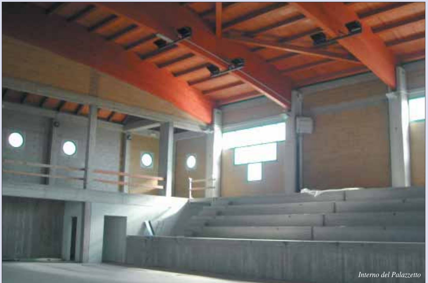
Interno del Palazzetto