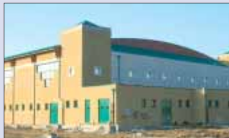
Palazzetto dello sport: lato nord

lontà del Comune, non ultima la risoluzione in danno operata dall'Amministrazione comunale nei confron-