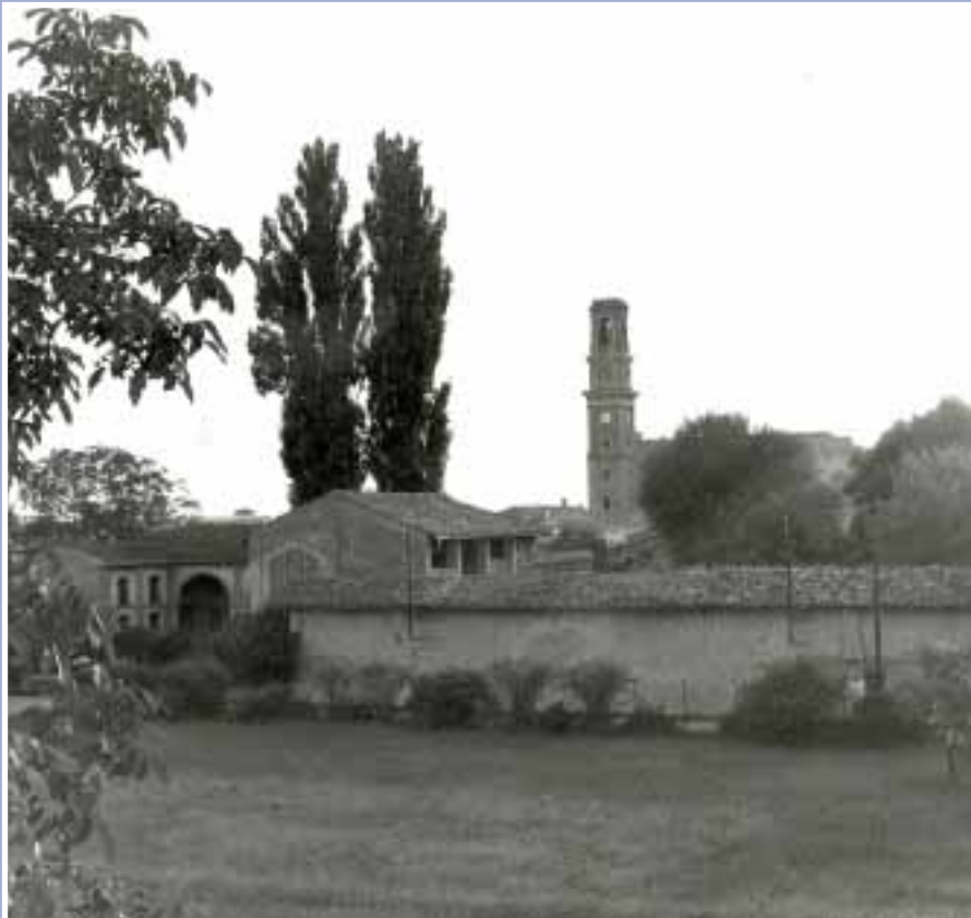
Offanengo in cartolina

Gli interventi sul sociale sono da anni patrimonio della nostra comunità. Ultimamente sono diventate sempre più critiche le condizioni delle famiglie, con particolare riferimento proprio ai minori, la parte più debole; questo accade anche a causa del progressivo indebolimento di un istituto quale la famiglia tradizionale, che è il pilastro della nostra società.