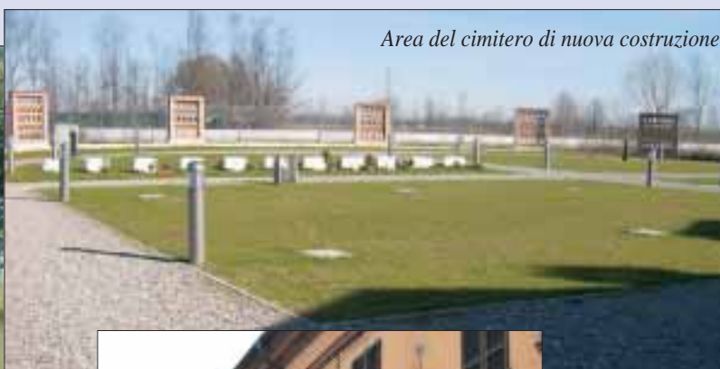
Area del cimitero di nuova costruzione

In questo numero del Notiziario Comunale vogliamo inoltre focalizzare l'attenzione sulle opere pubbliche previste nel bilancio 2007. Nonostante le difficoltà del bilancio l'amministrazione comunale intende portare avanti le opere pubbliche che ritiene più importanti.