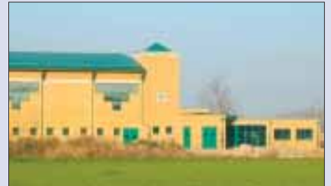
Palazzetto dello sport: lato est

ti della società costruttrice e la riassegnazione degli appalti per il com-