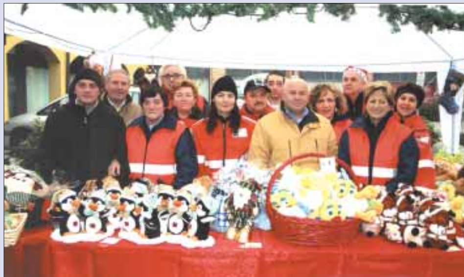
I volontari della Croce Verde Offanengo

A livello umano ogni aiuto può essere importante. In questo momento, per esempio, manca un centralinista che possa prendere le chiamate e smistarle ai volontari. Basterebbe un impegno di poche ore a seconda del-