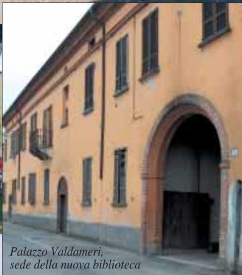
Palazzo Valdameri, sede della nuova biblioteca