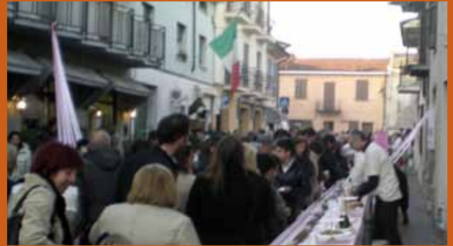
Sagra del maiale 2011.

Anche quest'anno l'autunno Offanenghese è stato protagonista, hanno avuto di fatto un grande successo le manifestazioni "Sapori d'autunno" e la "Sagra del Maiale", entrambe arrivate alla seconda edizione, svoltesi rispettivamente domenica 9 Ottobre e domenica 13 novembre.