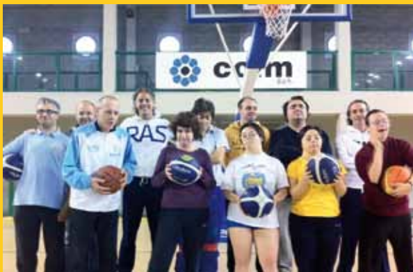
La squadra al completo.

"...non si vince in undici uomini, ma si vince con una squadra..."