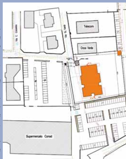
Dove si trova il nuovo asilo.