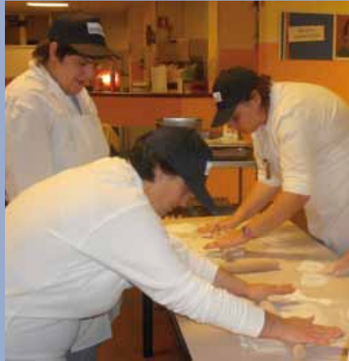
I ragazzi in cucina.

Il 16 Novembre ha preso il via il corso di cucina per i ragazzi diversamente abili, organizzato dalla Sodexo Italia S.p.a, ditta che fornisce i pasti agli alunni delle scuole di Offanengo, in collaborazione con il Comune di Offanengo e l'Associazione New Open Crema. Le lezioni si sono tenute presso il Ristorante Self-Service in via Matilde di Canossa a Crema e hanno coinvolto 19 ragazzi del cremasco, di cui due offanenghesi. L'obiettivo non è stato solamente quello di offrire ai ragazzi un corso di cucina ma anche un aggiornamento sui principi dell'Educazione alimentare, sicuramente molto utile a renderli autonomi anche nella quotidianità. Si sono esercitati ad usare le attrezzature messe a loro disposizione, affiancati dallo chef e dai tutor. I ragazzi, attraverso un laboratorio sperimentale di educazione alimentare hanno imparato a conoscere i vari alimenti ed il loro corretto abbinamento al fine di preparare piccole ricette base, come la preparazione di salse, pizzoccheri, gnocchi, scaloppine, dolci e molto altro. Hanno inoltre imparato ad acquistare i prodotti necessari utilizzando consapevolmente il denaro. Al termine del