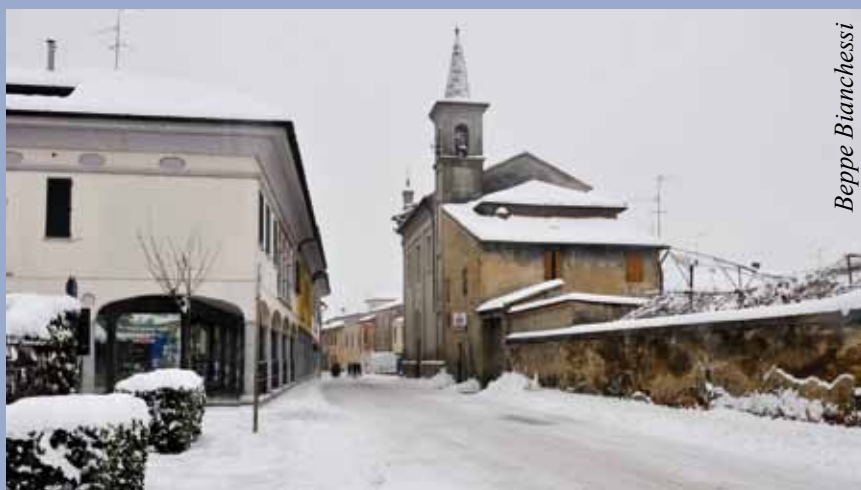
Via Madonna del Pozzo innevata.

È questo il momento di evitare inutili contrapposizioni e conflitti; è il momento di riscoprire il senso dell'unità, la capacità di ascolto reciproco che rafforza la coesione sociale, la ricerca della giustizia, valori senza i quali non potrà esserci né pace, né benessere sociale, né sviluppo economico. Rivolgo a tutti il mio invito fraterno a ritrovare il sentimento della solidarietà e della condivisione, a non permettere che alcuno tra i nostri concittadini si senta emarginato o rimanga solo ad affrontare le difficoltà. Offanengo è ricco di risorse umane; tante sono le associazioni, i gruppi spontanei, le singole persone, le aziende e gli enti su cui so di poter contare perché non si perda la tradizionale e innata capacità dei cittadini di far fronte alle avversità. Intendo rivolgere direttamente e personalmente ai rappresentanti di quello che è il ricco e composito tessuto associazionistico offanenghese il