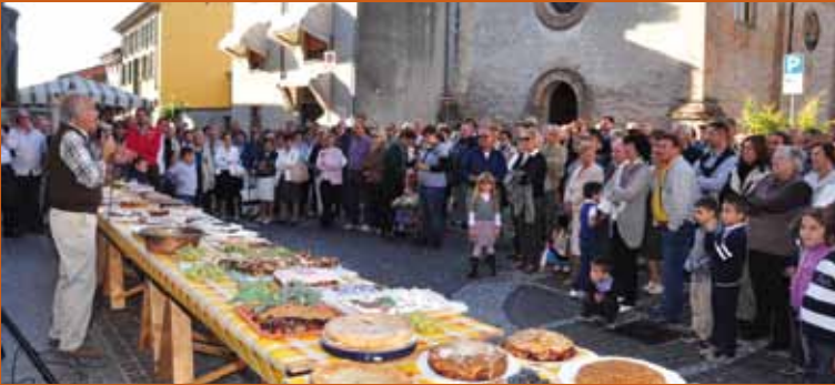
Gara delle bertoline 2011.