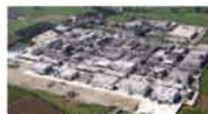
ITALY - OFFANENGO - 40 Hectares (120 Acres)