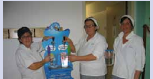
Le cuoche con il nuovo erogatore.

E' stato installato dalla Società Sodexo, presso la mensa scolastica, un erogatore di acqua che ha permesso l'eliminazione dell'acqua in bottiglia e di servire l'acqua ai tavoli utilizzando le brocche.