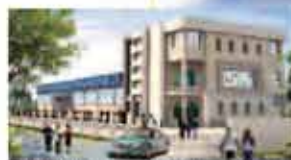
INDIA - NEW DELHI (from 2012) - 1 Hectares (2,5 Acres)