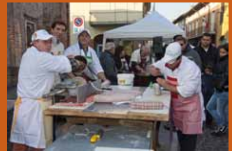
I norcini all'opera.

Da non dimenticare anche la gara delle bertoline, insomma un programma coi fiocchi. Non da meno, la Sagra del Maiale, con tutte le sue iniziative come i 20 metri di salame al cioccolato realizzati da 70 offanenghesi e poi distribuiti ai cittadini, l'esibizione dei maestri norcini che hanno insaccato alcuni salumi, il coinvolgimento delle scuole di Offanengo nella realizzazione di lavoretti e le degustazioni offerte dai bar. Durante la serata sono stati infine estratti i numeri vincenti della lotteria della sagra, che ha messo in palio numerosissimi premi offerti dai commercianti del paese. Due eventi sicuramente ben riusciti, perciò si intende ringraziare tutti i commercianti