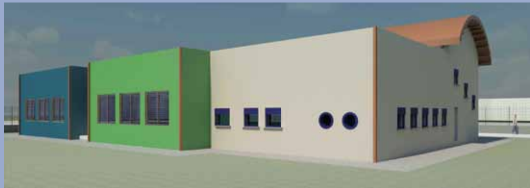
Rendering del nuovo asilo.

Sono iniziati i lavori per la costruzione del nuovo asilo nido di Offanengo. La ditta aggiudicatrice della gara è stata la Sandrini spa di Casalromano (Mn). L'attuale asilo nido è ubicato in una struttura prefabbricata divenuta inadeguata. L'Amministrazione Comunale ha deciso di dare il via alla nuova costruzione. L'area scelta per il nuovo asilo nido è di