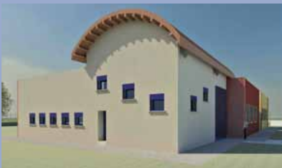
Fronte in prospettiva tridimensionale.

L'Amministrazione comunale aumenterà così la dotazione di posti nell'asilo nido comunale, fornendo un servizio migliore per le famiglie ed un aiuto concreto alle donne lavoratrici.