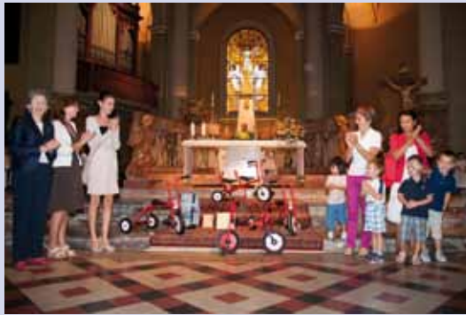
La consegna delle bicicletture durante la festa di inizio anno scolastico.

Nella seduta del Consiglio Comunale del 21 novembre è stato approvato all'unanimità il piano del diritto allo studio del Comune di Offanengo. Si tratta degli interventi comunali a favore della scuola dell'Infanzia Regina Elena e delle scuole dell'Istituto Comprensivo G. Falcone e P. Borsellino, in particolare la materna Renato Contini, la primaria Alessandro Manzoni e la secondaria di I grado Dante Alighieri.