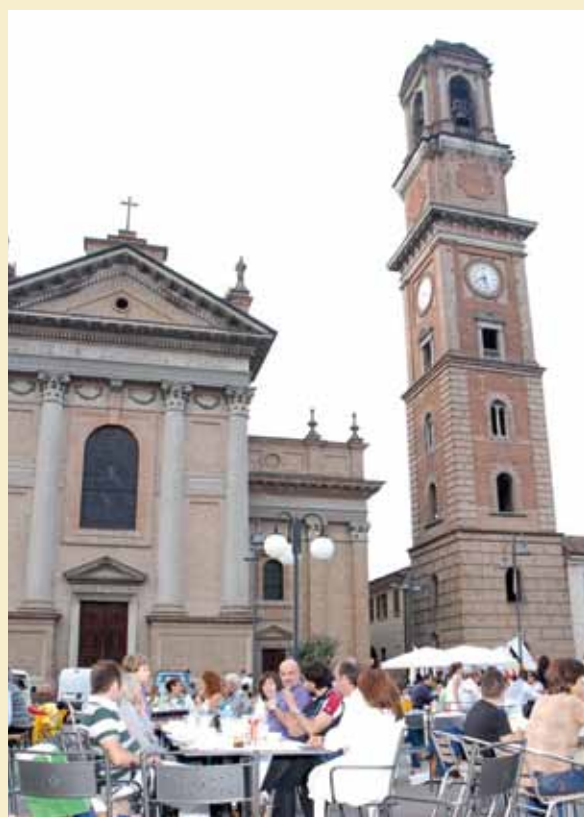
Un momento della festa di fine anno scolastico in Piazza Sen. Patrini

I fondi verranno utilizzati per l'acquisto di materiale necessario all'attività didattica, ossia di una lavagna multimediale per la scuola primaria, di attrezzature sportive per la