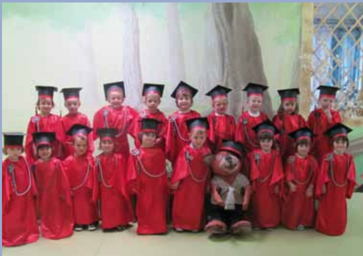
Il gruppo dei bambini che hanno ricevuto la laurea.