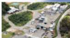
BRAZIL - VINHEDO - 16 Hectares (40 Acri)