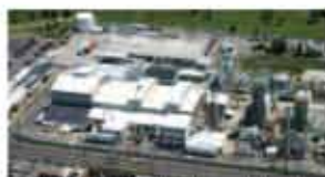
USA - NJ - POULSBORO - 3 Hectares (8 Acri)