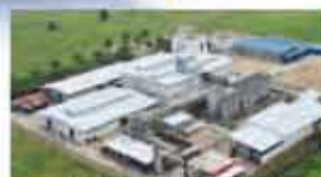
SINGAPORE - 4 Hectares (10 Acri)