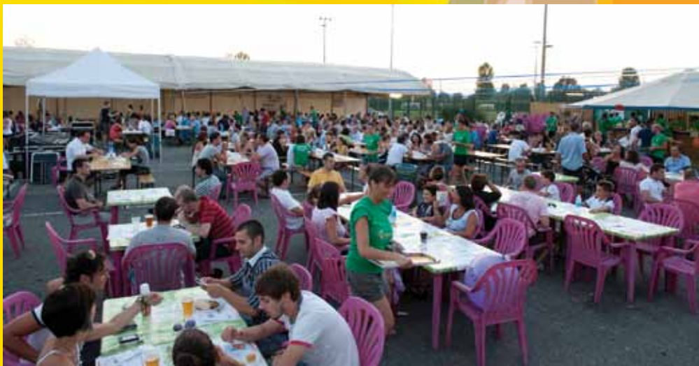
Alla Festa dello Sportivo è stato possibile degustare ottimi piatti tipici.

Da subito l'evento è stato molto apprezzato: infatti giovedì sera 'i nostrani' "Chei dal Furmai" grazie al loro rock territoriale hanno riempito il parterre. Venerdì il tributo ai Nomadi del gruppo Onda Nomade ha confermato le aspettative. Sabato sera una grande folla impazzita ha seguito i titolati Dejavu con il loro repertorio di musica leggera italiana. Nella giornata di domenica dalle 10.00 del mattino fino alla 1.00 di notte l'area vicino al Palacoim è stata continuamente movimentata: da prima con la S. Messa dello Sportivo, tenuta dal curato Don Emanuele, e successivamente dall'ottimo pranzo. In serata sarebbe stato il clou: i centinaia di posti a sedere erano colmi fin dalle 19.30; purtroppo un temporale improvviso e violento ha stoppato la band dei Discomania che avrebbe sicuramente animato come non mai il pubblico. Nonostante le difficoltà lunedì mattina abbiamo rimesso tutto in ordine e con un passa parola incredibile abbiamo ri-