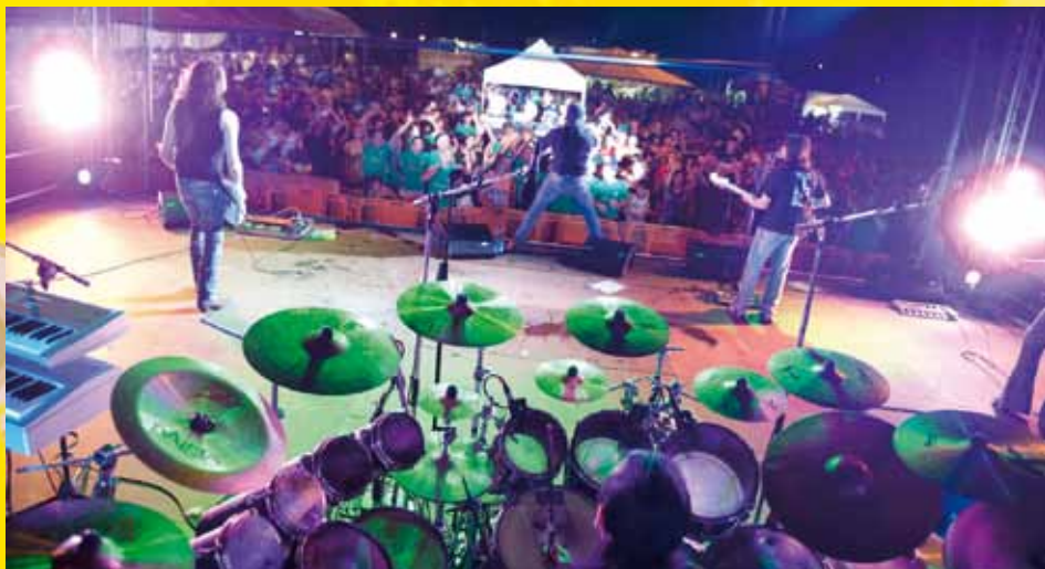
Il concerto dei "Blascover"