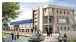
INDIA - NEW DELHI (from 2012) - 1 Hectares (2,5 Acri)