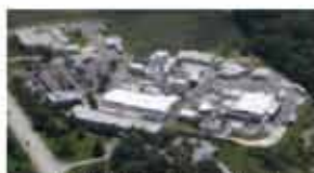
USA - NJ - WD - 16 Hectares (40 Acri)