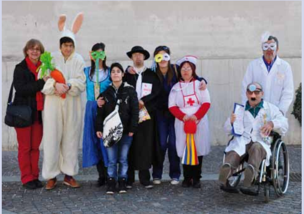
Vestito in modo bizzarro e carico di buon umore, il Gruppo La Colonna alla manifestazione "Offanengo in maschera"

Anche quest'anno abbiamo attivato il laboratorio "Bomboniere: Che Passione!" mettendo a disposizione la nostra arte e la