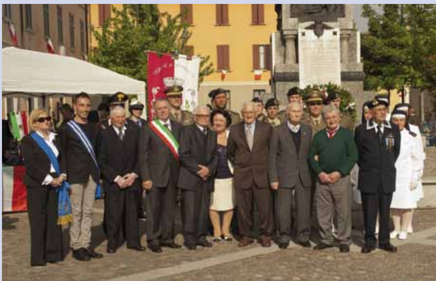
La manifestazione del 1° Maggio 2011

Gli alunni delle scuole primaria e secondaria hanno invece dato il loro contributo alle celebrazioni leggendo e recitando poesie e passi della