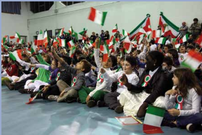
Gli alunni delle scuole durante la manifestazione del 17 marzo 2011

Dobbiamo essere coscienti che l'unità e l'identità nazionale non è un dato acquisito una volta per sempre, è un compito attuale che si costruisce, definisce ed arricchisce continuamente contro