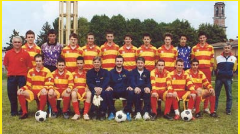
Squadra Juniores premiata