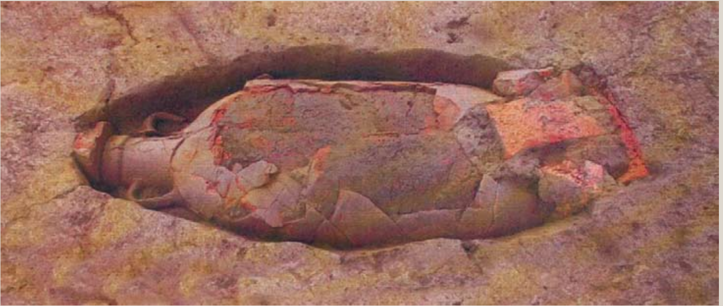
Sepoltura di un infante entro anfora