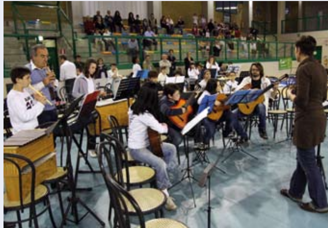
Talent Show 2010 Offanengo

In quest'ottica di apertura verso l'esterno da parte della scuola, si aggiungono altri obiettivi considerati fondamentali dall'amministrazione comunale, vale a dire la partecipazione della scuola alla vita della Comunità e la collaborazione con le associazioni presenti in paese. Grazie alla preziosa collaborazione degli insegnanti, gli alunni sono chiamati a partecipare attivamente ad alcuni eventi del paese, quali ad es. "Il Natale da Favola" (bancarelle natalizie), il "Settembre Offanenghese" (mostra di pittura), oppure a creare essi stessi degli eventi (concerto junior band ed orchestra d'istituto).