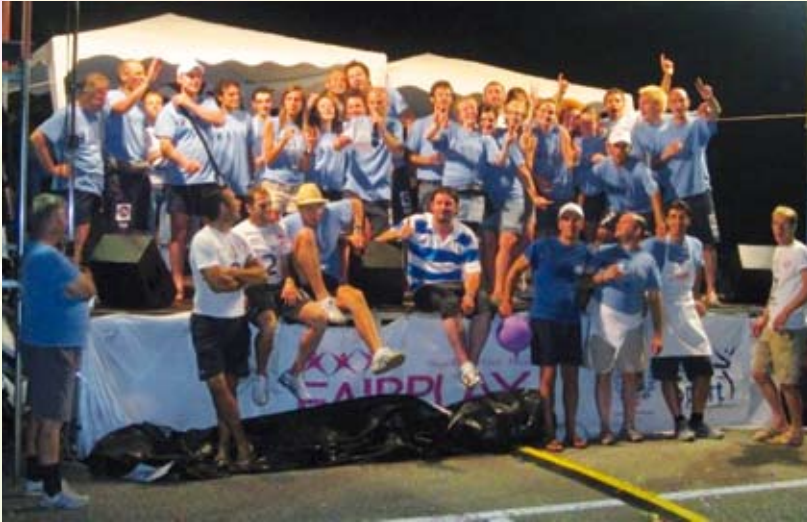
Tutti gli organizzatori della Festa dello Sportivo

Dal 1° al 5 luglio cinque serate non stop tra sport, musica, buona cucina ed allegria