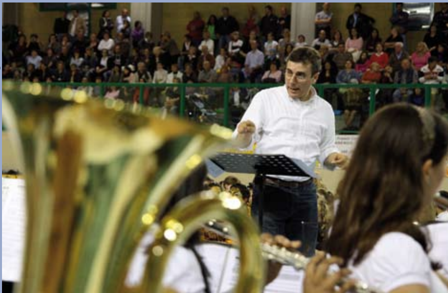
E' nata la Junior Band, la banda dei ragazzi dell'Istituto Comprensivo di Offanengo. (articolo a pagina 3)