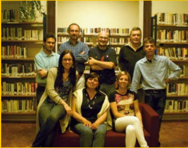
La Commissione Biblioteca

Rendere dunque una biblioteca viva, che sia non solo luogo di studio ma anche teatro di aggregazione sociale e attivo servizio ai cittadini, è l'obiettivo primario della rinnovata Commissione Biblioteca. La Commissione, costituita dal Presidente e da 8 membri eletti, dei quali 5 designati dalla maggioranza consiliare e 3 dalla minoranza, ha il compito di coordinare e agevolare l'operato della biblioteca attraverso un collega-