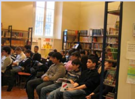
Uno degli incontri "Viaggio nel mondo della Costituzione"

Anche quest'anno nell'ambito del diritto allo studio, la scuola con il contributo dell'amministrazione locale ha realizzato numerosi progetti a sostegno dell'offerta formativa. Se ne riportano tre particolarmente significativi e di grande attualità.