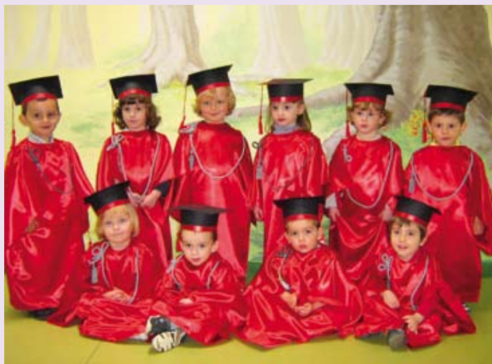
Il gruppo dei "Grandi" durante la consegna dei diplomi.

una nuvola posta all'ingresso del giardino con una significativa frase: "L'anima non vedrebbe l'arcobaleno se gli occhi non avessero lacrime", perché proprio le lacrime hanno dato voce alle emozioni che i papà e le mamme hanno provato durante le fasi di ambientamento quando, per la prima volta, hanno affidato i loro figli ad altri adulti sperimentando la fatica della prima separazione. Lacrime che hanno dato voce anche alle fatiche dei bambini, che sono state accompagnate dalle educatrici attraverso due interessanti e coinvolgenti progetti: "Progetto accoglienza" e "...mamma dove sei?" dove si è favorito l'ambientamento della coppia genitore - bambino gettando le basi di un rapporto di collaborazione e fiducia: offrendo ai bambini la possibilità di