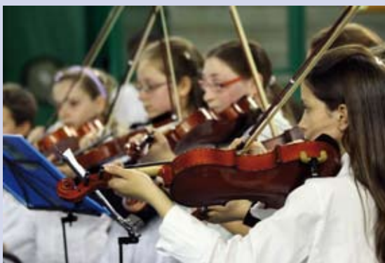
Musicisti durante la manifestazione Talent Show

ma avente, appunto, ad oggetto i principi della costituzione, l'ordinamento giuridico dello stato, gli enti locali (in particolare gli organi e competenze del comune) con uno sguardo alle realtà associative e di volontariato presenti in paese. L'ultimo incontro ha avuto come relatore il Presidente della Croce Verde di Offanengo Carlo Patrini . Nell'ambito del progetto, sono state, inoltre, organizzate ogni sabato del mese di maggio, per le classi prime della Scuola Secondaria di primo grado, delle visite guidate in Municipio allo scopo di avvicinare i ragazzi all'istituzione locale. Gli studenti, guidati dalle dipendenti dell'U.R.P. e da un amministratore, hanno avuto la possibilità di visitare i vari uffici: dalla ragioneria all'ufficio tecnico, dalla segreteria all'anagrafe e ai servizi sociali, incontrando gli "addetti ai lavori" e ricevendo informazioni sulle tematiche che devono affrontare, e sui riflessi dell'attività comunale sulla vita dei cittadini. Tale progetto costituisce un'occasione importante per approfondire un argomento, già inserito nella programmazione didattica, con professionisti in grado di creare negli alunni maggior interesse su questioni importanti, quali sono le regole del Comune ed in generale del vivere civile.