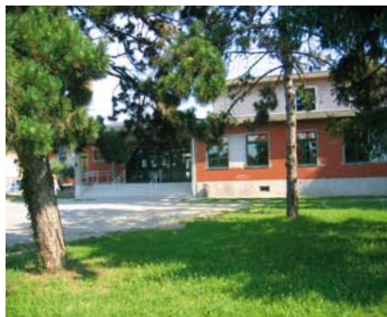
La scuola secondaria di I grado

La maggior parte dei lavori verranno realizzati durante il periodo estivo e saranno conclusi per l'inizio delle scuole, altri lavori minori verranno invece eseguiti durante il corso dell'anno scolastico.