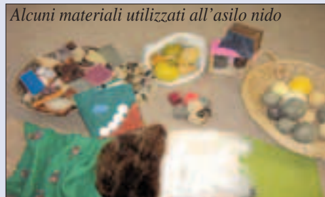
Alcuni materiali utilizzati all'asilo nido