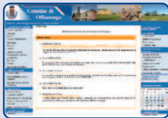
Home Page del nuovo sito comunale

Passando il mouse sul calendario sottostante si accede alle news, agli incontri,