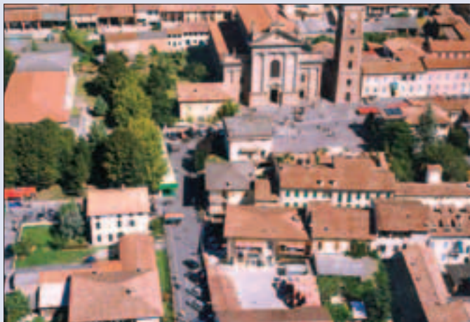
Veduta aerea del centro

L'innalzamento e l'abbellimento della sede stradale caratterizzeranno quindi in maniera evidente il centro storico con il manifesto intento di moderare la velocità veicolare e di favorire la formazione di una zona commerciale all'aperto dove sia pos-